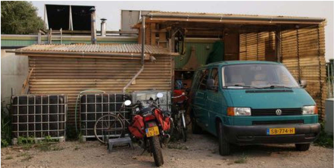
Sleutel- en wasruimte op regenwater